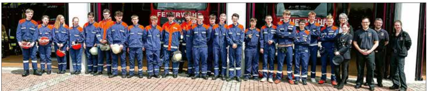
Die Teilnehmenden freuen sich über die bestandene Prüfung und erhalten die Bayerische Jugendleistungsspange.